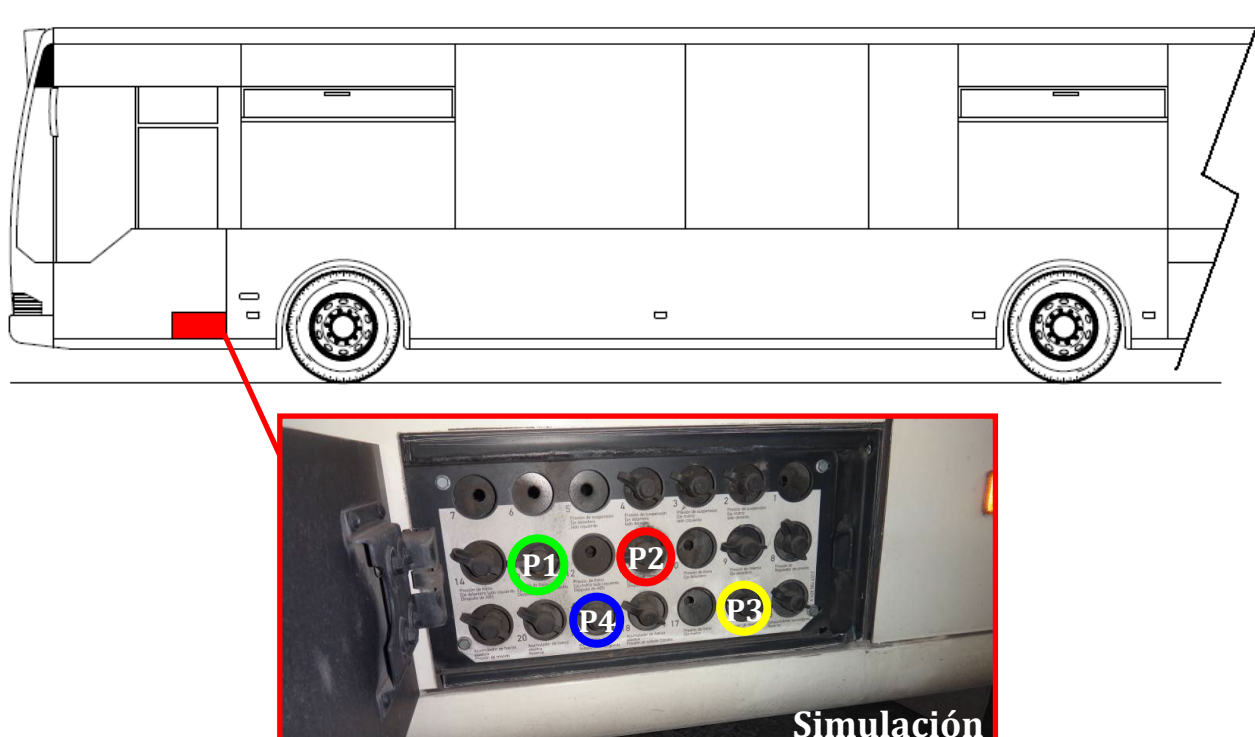
Imagen 2: Toma sensores de presión